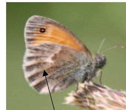
Petits points blancs sur le dessous de l'aile postérieure