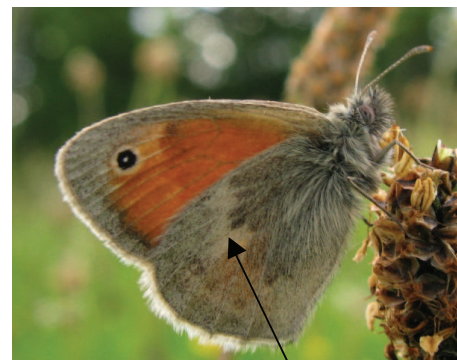
Ligne blanche irrégulière sur le dessous de l'aile postérieure

C. Gaumont, M. Renard / Noé Conservation