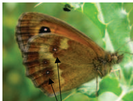
Ocelles bruns noirs ponctués de blanc sur le dessous de l'aile postérieure