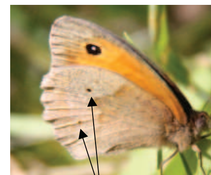
Parfois des petits points noirs le dessous de l'aile postérieure